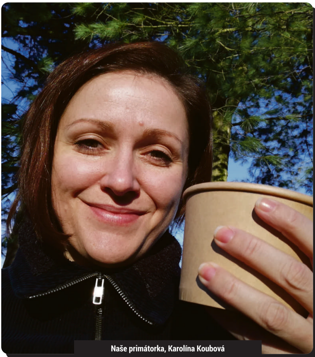
Naše primátorka, Karolína Koubová

A jak je to tedy s politickou kariérou Karolíny Koubové? „Já jsem ty ambice nikdy neměla, ale život se vás často neptá. Vždycky jsem chtěla dostávat do světa nápady, o kterých jsem přesvědčena, že jsou zajímavé a hlavně prospěšné. A to se snažím dělat i pro Jihlavu a jsem hrdá na to, že se mi to s mými kolegy daří,“ dodává s úsměvem. „A teď musím běžet, potřebuju totiž dořešit jeden super projekt, který ocení hlavně maminky s dětma,“ loučí se a je pryč.